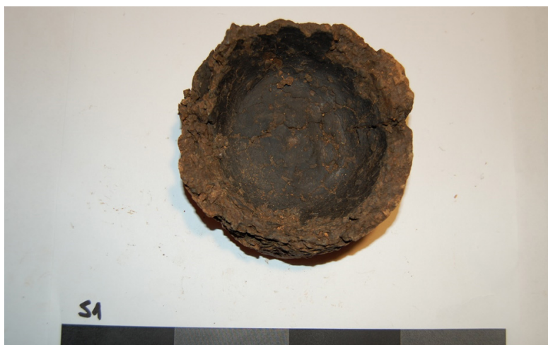
Slika 3. Sonda 1: Dno okrugle posude sa zidovima

Tokom iskopavanja u Sondi 1 pojavio se dubok kulturni sloj neolitske keramike, životinjskih kostiju, ali metalnih nalaza nije bilo. Pronađeno je dosta posudica, sa okruglim dnom, koje su se počele pojavljivati na dobini od 1.5m. Sonda je kopana do dubine od 2.4 metra gdje se došlo do zdavice.