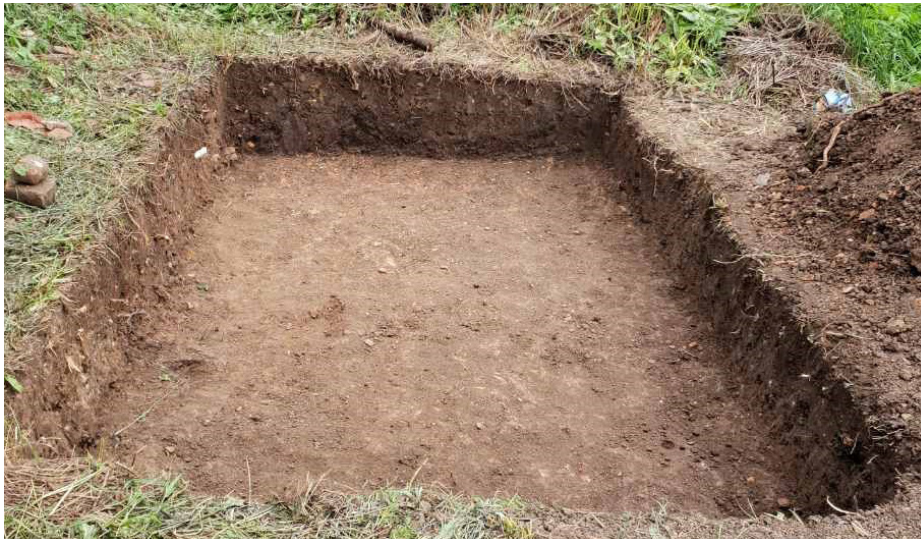
Slika 1. Sonda 3

Prvog dana arheološkog iskopavanja otvorene su: Sonda 1 i Sonda 2, te Sonda 3, paralelna sa Sondom 1 u pravcu istoka, malo većih dimenzija (3 x 2 metra). Međutim, zbog pojavljivanja predmeta iz moderne austrougarske gradnje u Sondi 2, te crvenkaste keramike, zajedno sa kućnim ljepljkom u Sondi 3, te su sonde iz praktičnih razloga ostavljene za neka dalja istraživanja.