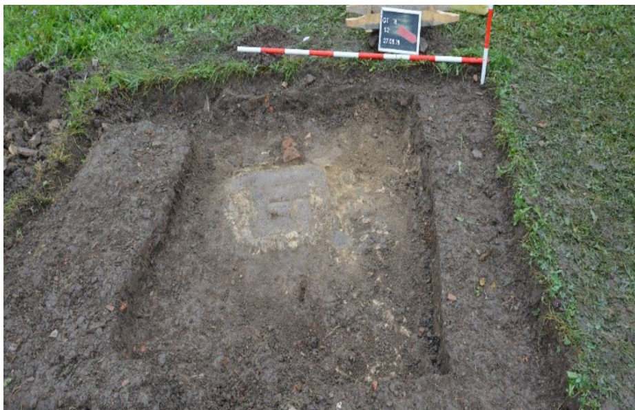
Slika 2. Austrougarski period

Tokom iskopavanja u Sondi 1 pojavio se dubok kulturni sloj neolitske keramike, životinjskih kostiju, ali metalnih nalaza nije bilo. Pronađeno je dosta posudica, sa okruglim dnom, koje su se počele pojavljivati na dobini od 1.5m. Sonda je kopana do dubine od 2.4 metra gdje se došlo do zdavice.